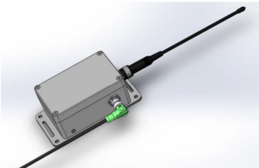
Figure 5: Aperçu boîtier fermé