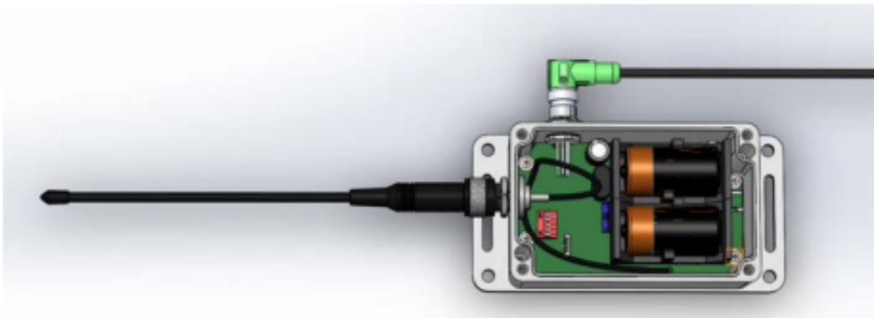
Figure 4: Aperçu boîtier ouvert