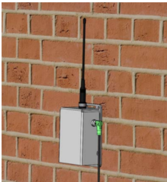
Figure 6: Aperçu boîtier fermé + protection thermique montée