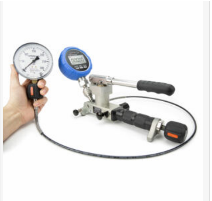
Utilisation position horizontale