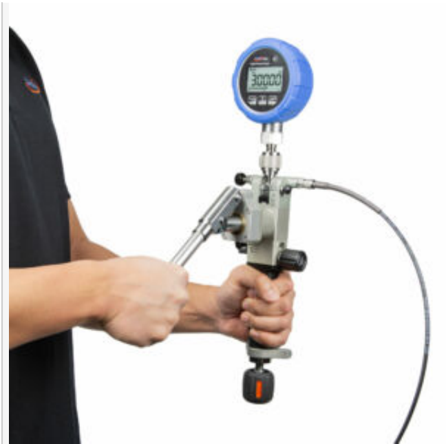
Utilisation Position verticale